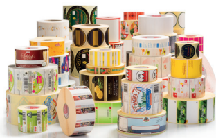
Etikettenaufwickler und Etiketten