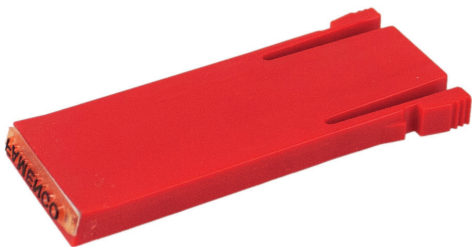
Illustration 27 Eksempel på trykpladeskyder