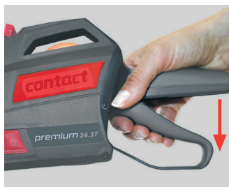
Illustration 10 Deaktivering af håndtaget