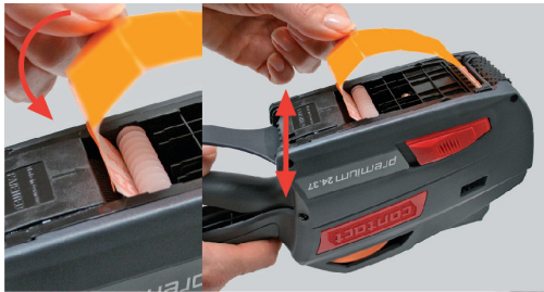
Illustration 21 Det bærende papir mellem styrerulle og transporthjul

4. Før det bærende papir ind bag styrepinden i bunden.