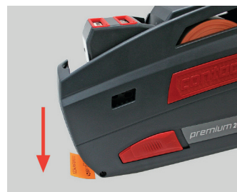
Figura 11 Pegar la etiqueta