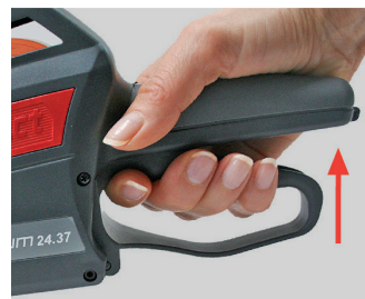
Figura 9 Accionar la maneta