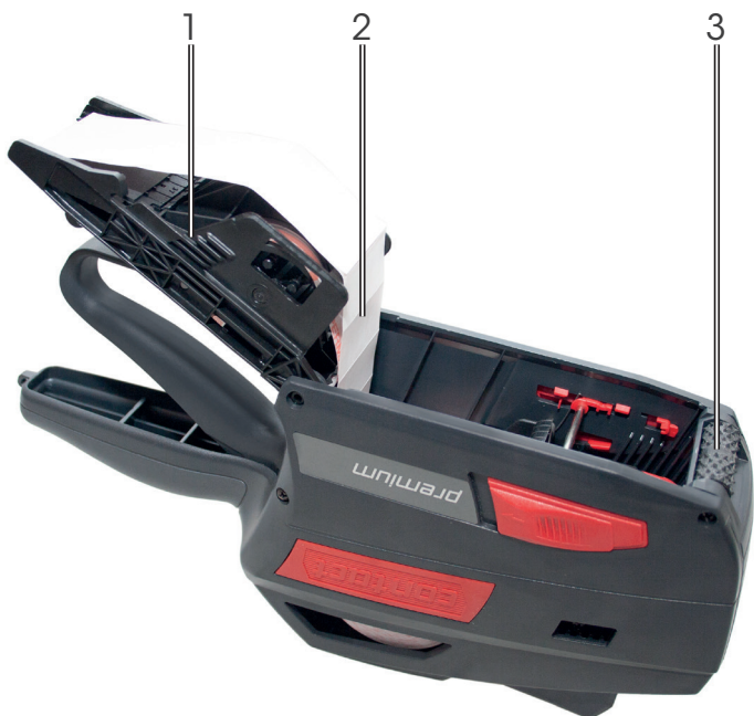
Figura 4 Etiquetadora manual abierta - Placa frontal