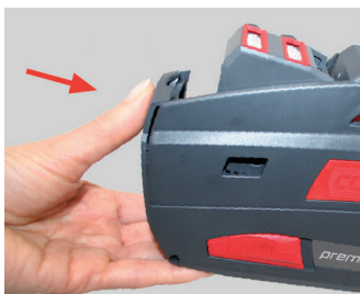
Figura 16 Cerrar la placa frontal