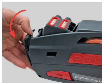
Figura 12 Abrir la placa frontal

❶ Sujete por el asidero la etiquetadora manual con una mano. No accione la maneta.