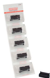
Figura 26 Ejemplos de rodillos entintadores en el blister

Puede ver la oferta de los diferentes rodillos entintadores en la página web del fabricante.