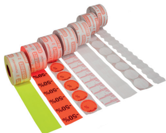
Figura 25 Ejemplos de rollos de etiquetas

Puede ver la oferta de los diferentes rollos de etiquetas en la página web del fabricante.