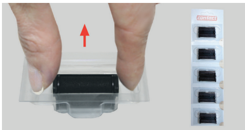
Figura 14 Extraer el rodillo entintador del embalaje