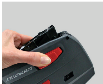
Figura 17 Abrir la base

① Sujete por el asidero la etiquetadora manual con una mano. No accione la maneta. La base debe mirar hacia usted.