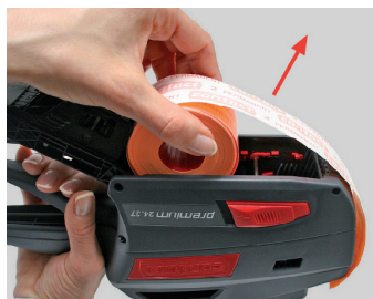
Figura 18 Extraer el rollo de etiquetas