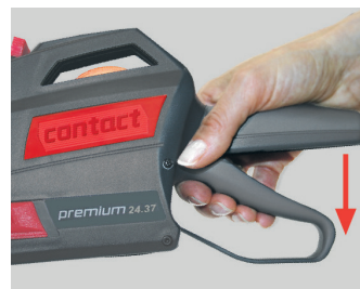
Figura 10 Soltar la maneta