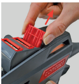
Figura 23 Sacar la corredera de clisés