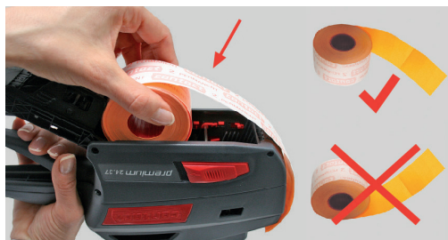
Figura 19 Colocar el rollo de etiquetas