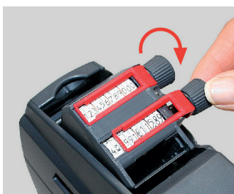
Figura 7 Ajustar el valor