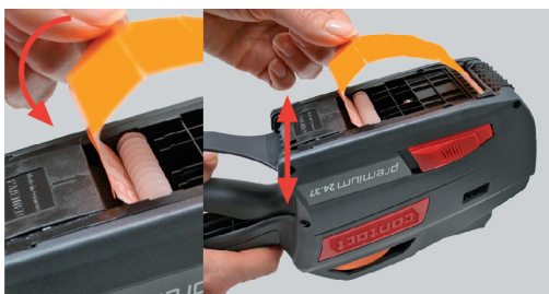
Figura 21 Papel portador entre el rodillo de inversión y la rueda de transporte

4. Enhebre el papel portador en la base detrás de los pasadores de guía.