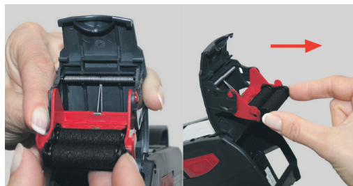
Figura 13 Retirar el rodillo entintador