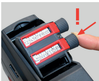
Figura 8 Empujar hacia atrás el botón de ajuste

❗ Sujete por el asidero la etiquetadora manual con una mano. No accione la maneta.