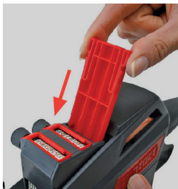
Figura 24 Colocar e insertar la corredera de clisés

Proceda de la siguiente manera para colocar la corredera de clisés: