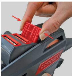
Figura 22 Comprimir los resortes de la corredera de clisés

Proceda de la siguiente manera para extraer la corredera de clisés: