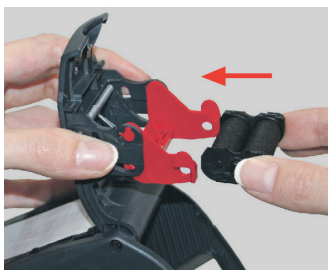
Figura 15 Colocar el rodillo entintador