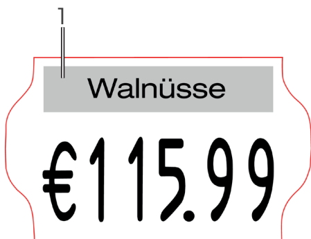
Figura 28 Ejemplo de impresión de clisé

Póngase en contacto con el fabricante para que le fabrique la corredera de clisés que usted desea.