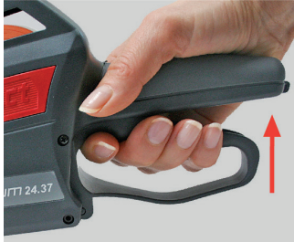
Kuva 9 Kahvan puristaminen