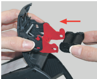
Kuva 15 Mustetelan asentaminen