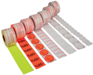
Kuva 25 Esimerkkejä etikettirullista

Etikettirullavalikoima on nähtävillä valmistajan kotisivuilla.