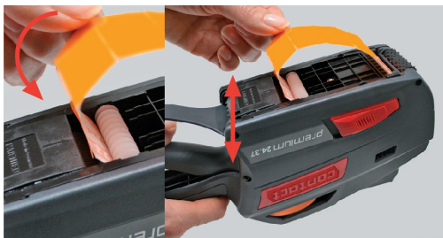
Kuva 21 Nauha taittorullan ja siirtorulla välissä