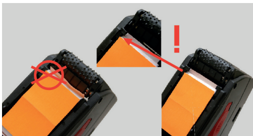
Kuva 20 Nauha ohjaintappien takana

❗ Vaiheet 1 ja 2 jäävät pois, kun käytät vanhaa etikettirullaa.