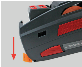
Kuva 11 Etiketin kiinnittäminen