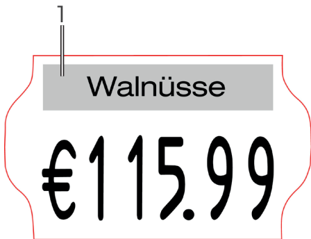
Kuva 28 Esimerkki lisäleimasinpainokuvasta

Ota yhteyttä valmistajaan lisäleimasimen tilausta varten.