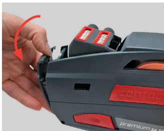
Kuva 12 Avaa etulevy