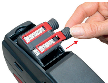
Kuva 6 Valitse kohta