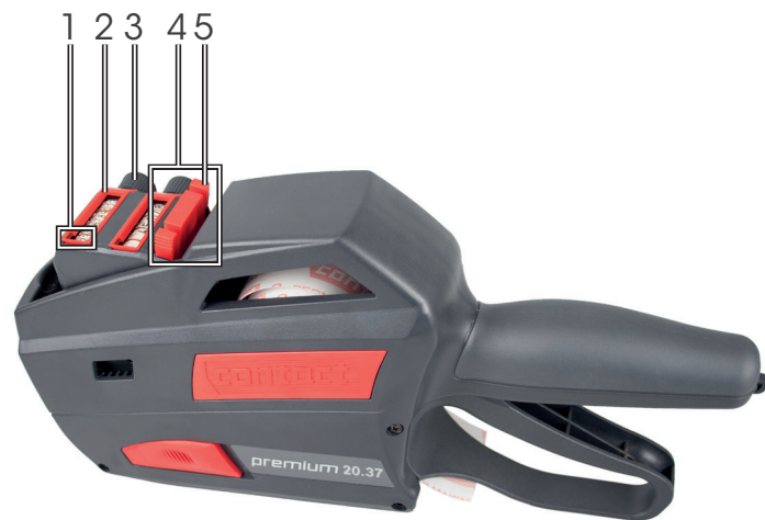
Kuva 2 Suljettu käsihinnoittelija – Pohja