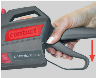
Kuva 10 Kahvan vapauttaminen