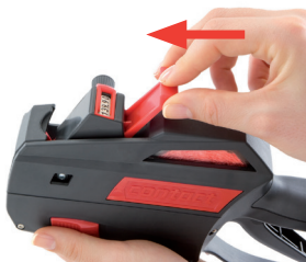
Rysunek 22 Dociskanie suwaka taśmy do przodu

Suwak taśmy wyjmuje się tak jak poniżej: