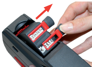
Rysunek 6 Wybór pozycji

Aby ustawić obraz druku, należy postępować jak poniżej: