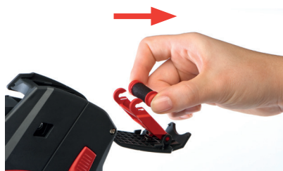
Rysunek 13 Wymywanie rolki farbowej