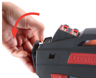
Rysunek 12 Otwieranie płytki przedniej