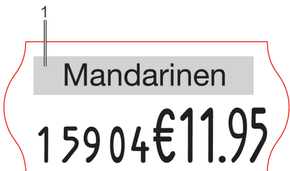
Rysunek 28 Przykład nadruku taśmy

Skontaktować się z producentem, aby opracował wybrany suwak taśmy.