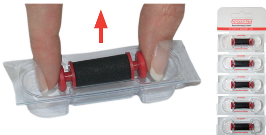
Rysunek 14 Wyjmowanie rolki farbowej z opakowania