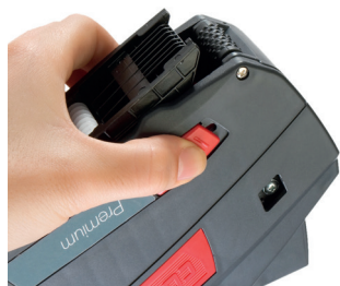
Rysunek 17 Otwieranie spodu