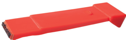
Rysunek 27 Przykład suwaka taśmy