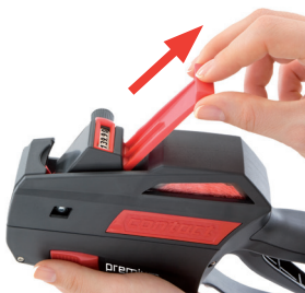
Rysunek 23 Wyciąganie suwaka taśmy