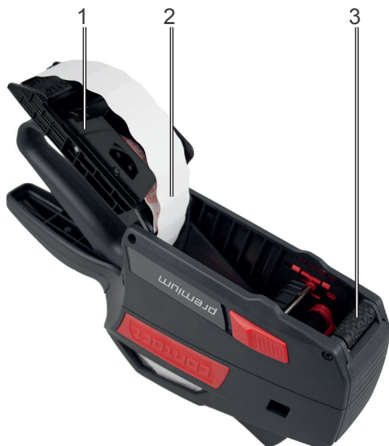
Rysunek 4 Otwarta metkownica ręczna – płytkę przednią