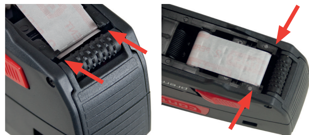
Rysunek 20 Papier nośny za trzpieniami prowadzącymi