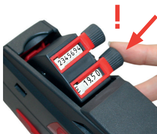
Rysunek 8 Cofanie guzika nastawczego

❗ Przytrzymać metkownicę ręczną jedną ręką za uchwyt. Nie naciskać rączki.