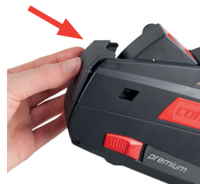
Rysunek 16 Zamykanie płytki przedniej