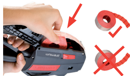
Rysunek 19 Wkładanie rolki etykiet