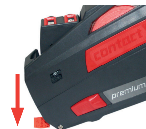
Rysunek 11 Naklejanie etykiety