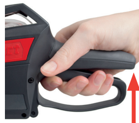
Rysunek 9 Naciśnięcie rączki