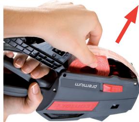
Rysunek 18 Wymywanie rolki etykiet