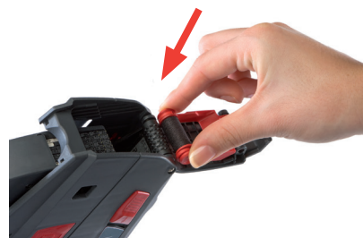
Rysunek 15 Wkładanie rolki farbowej