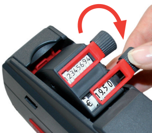
Rysunek 7 Ustawianie wartości