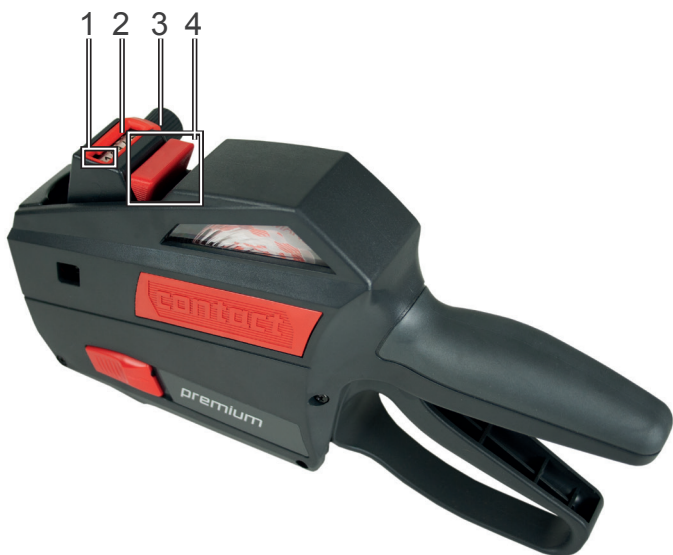
Rysunek 2 Zamknięta metkownica ręczna – spód