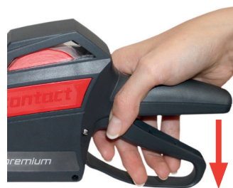
Rysunek 10 Puszczanie rączki