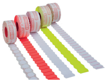
Rysunek 25 Przykład rolek etykiet

Ofertę różnych rolek etykiet można obejrzeć na stronie internetowej producenta.