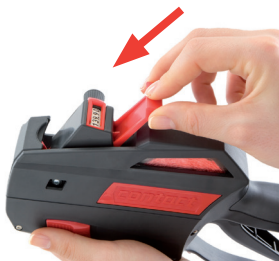
Rysunek 24 Wkładanie i wsuwanie suwaka taśmy

Należy postępować według tego punktu tylko wtedy, gdy jest suwak taśmy.