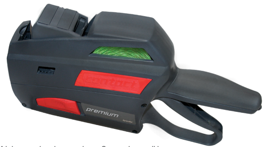
Abb. contact premium Spendegerät

Mit contact premium Spendegeräten können Sie die nachfolgenden Etiketten bequem und zielgenau auf Ihre Waren platzieren.