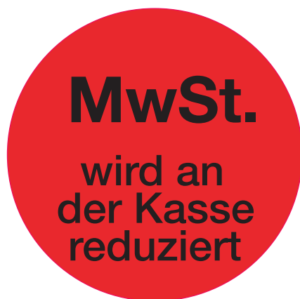
Abbildung entspricht nicht der Originalgröße