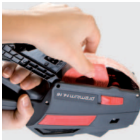
Schneller und einfacher Etikettenwechsel