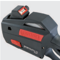
Vollschalengehäuse - Etikettenrolle liegt geschützt im Gerät