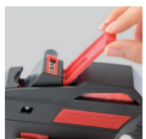
Individuelle Lösungen (Bsp. Klischeeschieber für Zusatzinformationen)