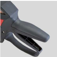
Ergonomisches Design - griff und angenehm

Sie möchten einfach und effizient auszeichnen? Dank ergonomischem Design geht das Etikettieren besonders angenehm von der Hand. Die Etiketten-Transporteinheit ermöglicht hochwertige, gleichbleibende Druckbilder und einen präzisen Etiketten-Vorschub - für besonders schnelles Auszeichnen!