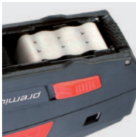
Sicherer und exakter Etikettentransport